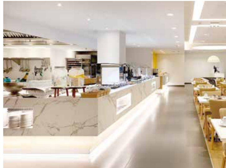
Proyecto / Project: Hotel Caleia Talayot / Hotel Caleia Talayot Ubicación / Location: Mallorca, España / Mallorca, Spain Estudio / Studio: Atemporal Home Interiors