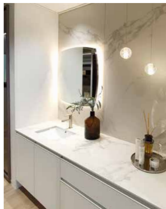
Proyecto / Project: Edificio de viviendas/ Residential Building Block Ubicación / Location: Seul, Corea del Sur / Seul, South Korea