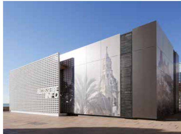
Proyecto / Project: Oficina de Turismo / Tourist information office Ubicación / Location: Alcocebre, España / Alcocebre, Spain Estudio / Studio: Sanshuja&Partners