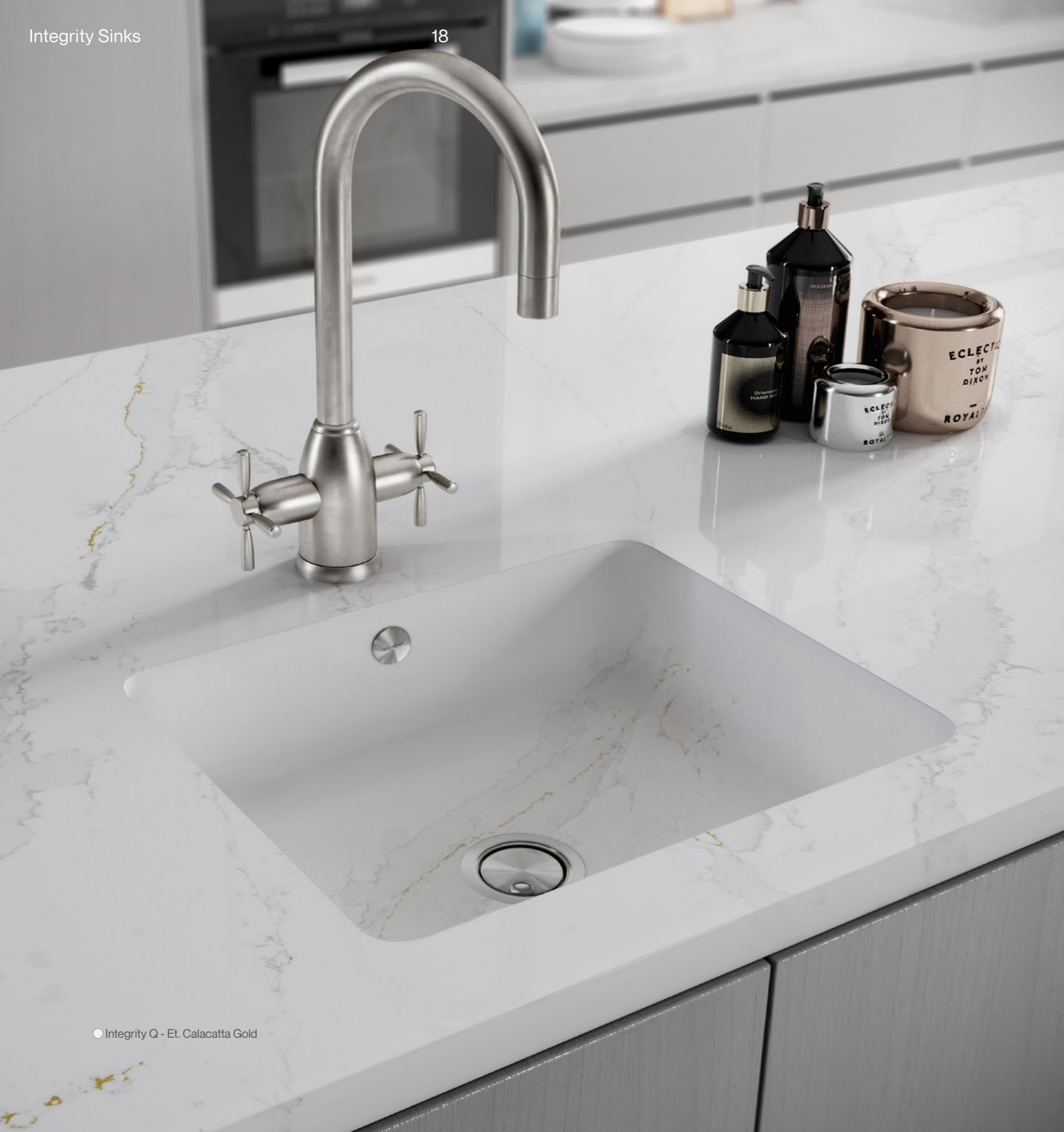
● Integrity Q - Et. Calacatta Gold