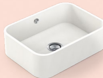
→ Integrity DUE L 51x37x15 cm R 6,5 cm