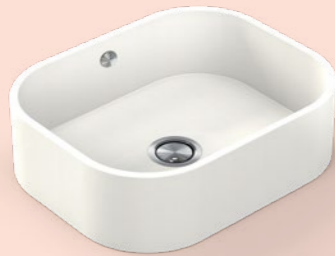
→ Integrity ONE 51x41x15 cm R 13 cm