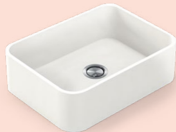
→ Integrity DUE XL 67x43,5x21 cm R 6,5 cm