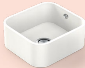
→ Integrity DUE S 34x37x15 cm R 6,5 cm