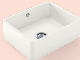
→ Integrity Q 51x41x15 cm R 3 cm